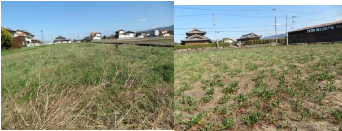
○3月21日(火) 墓参り、87番札所長尾寺参拝、友人との再会