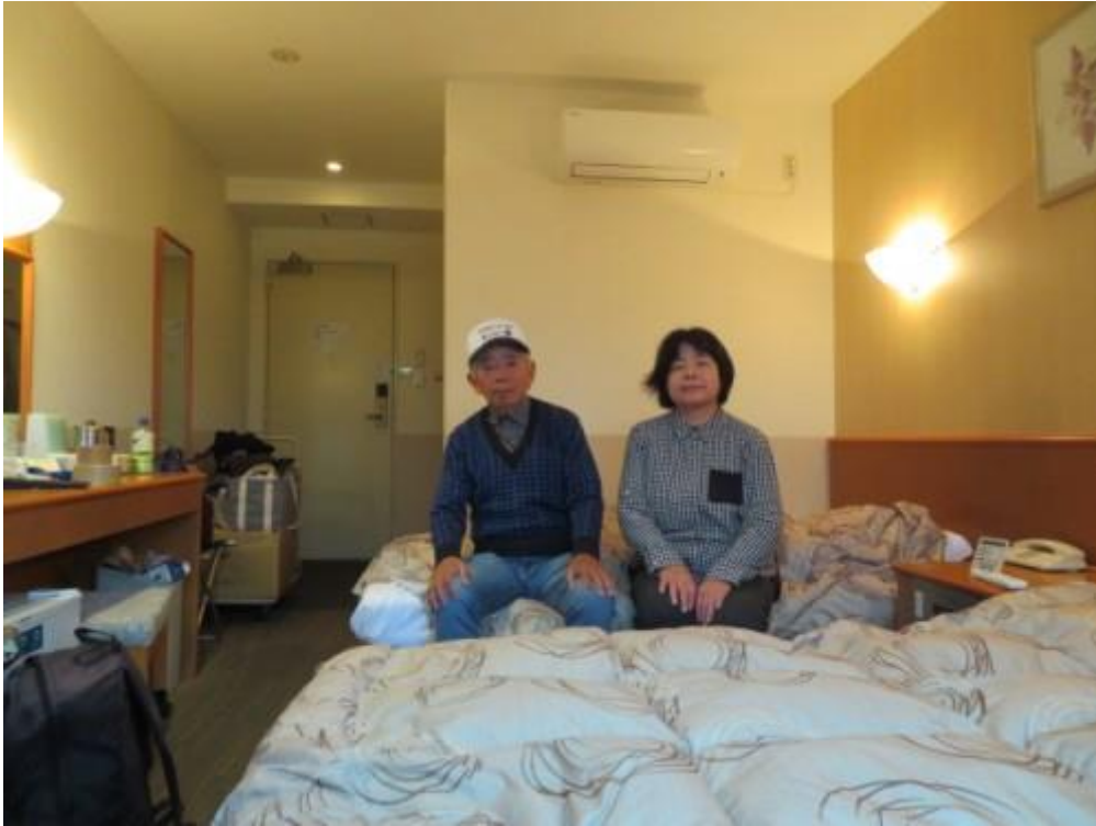
※ホテル No1 高松に 4 泊お世話になる