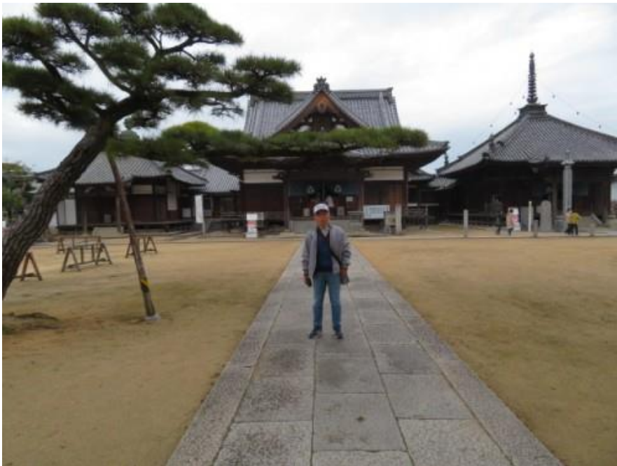
※87番札所”長尾寺～幼少の頃の十七度(8月17日)のお祭りを思い出し懐かしくなる