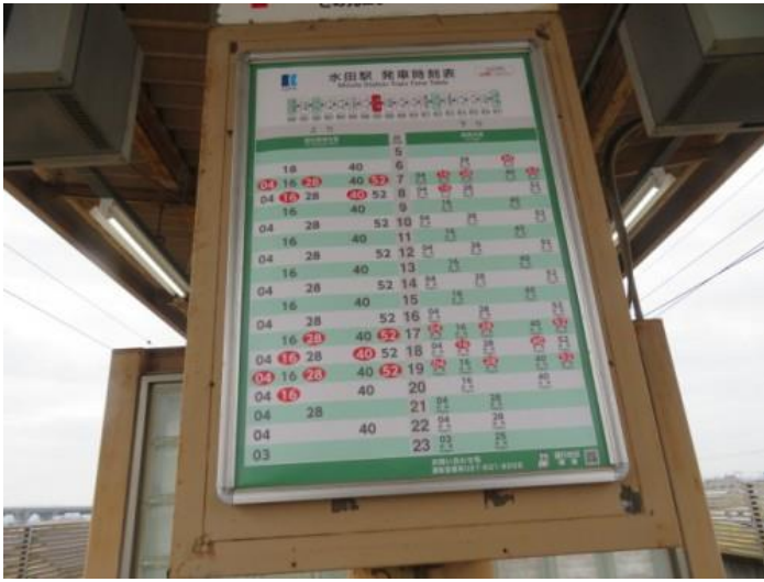
※琴電長尾線のダイヤ！！首都圏の鉄道路線ダイヤに負けません